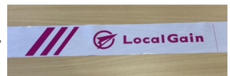
コーステープ実物写真