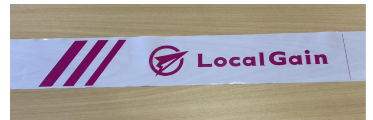
コーステープ実物写真