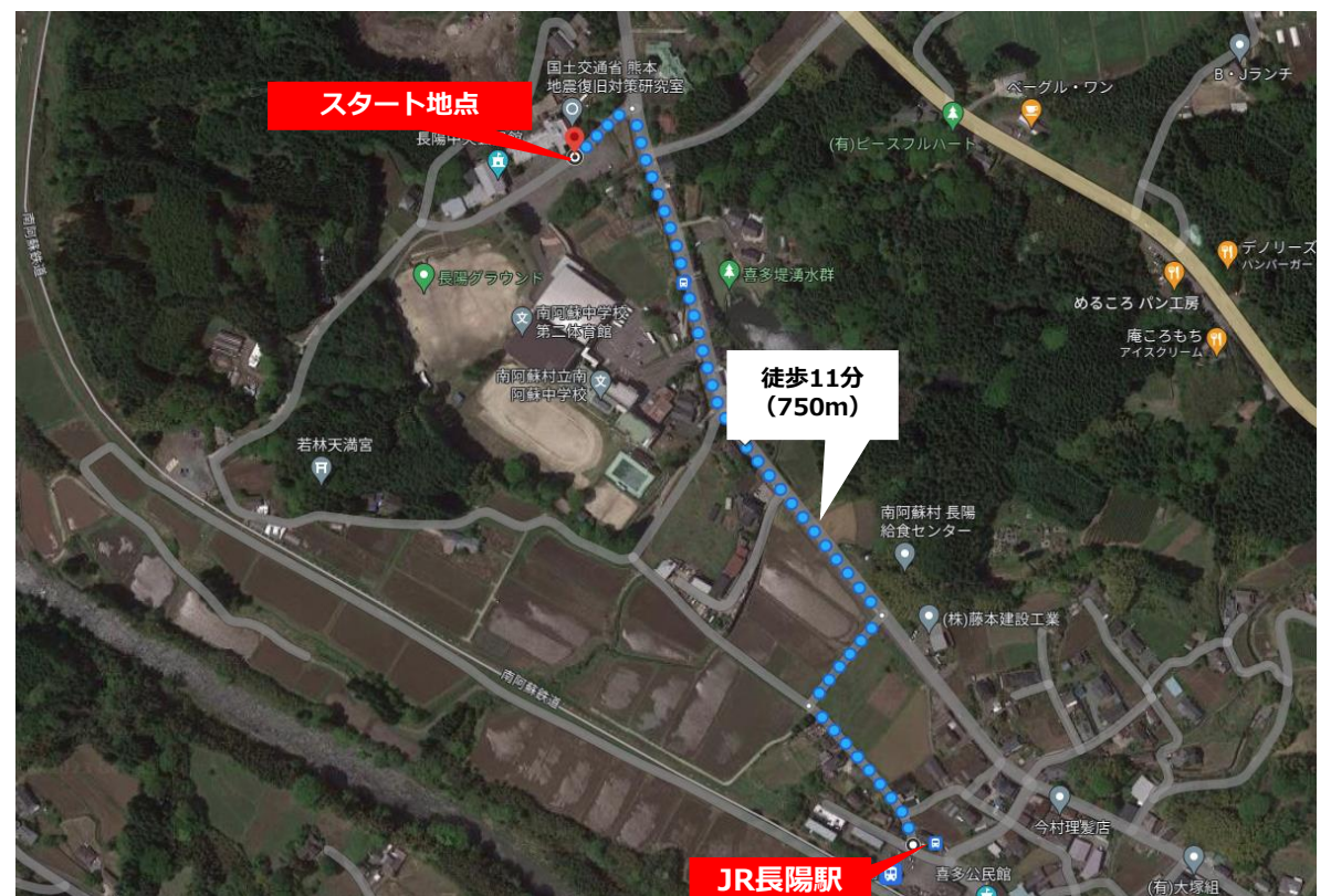
【長陽駅～スタート会場 (750m徒歩11分)】