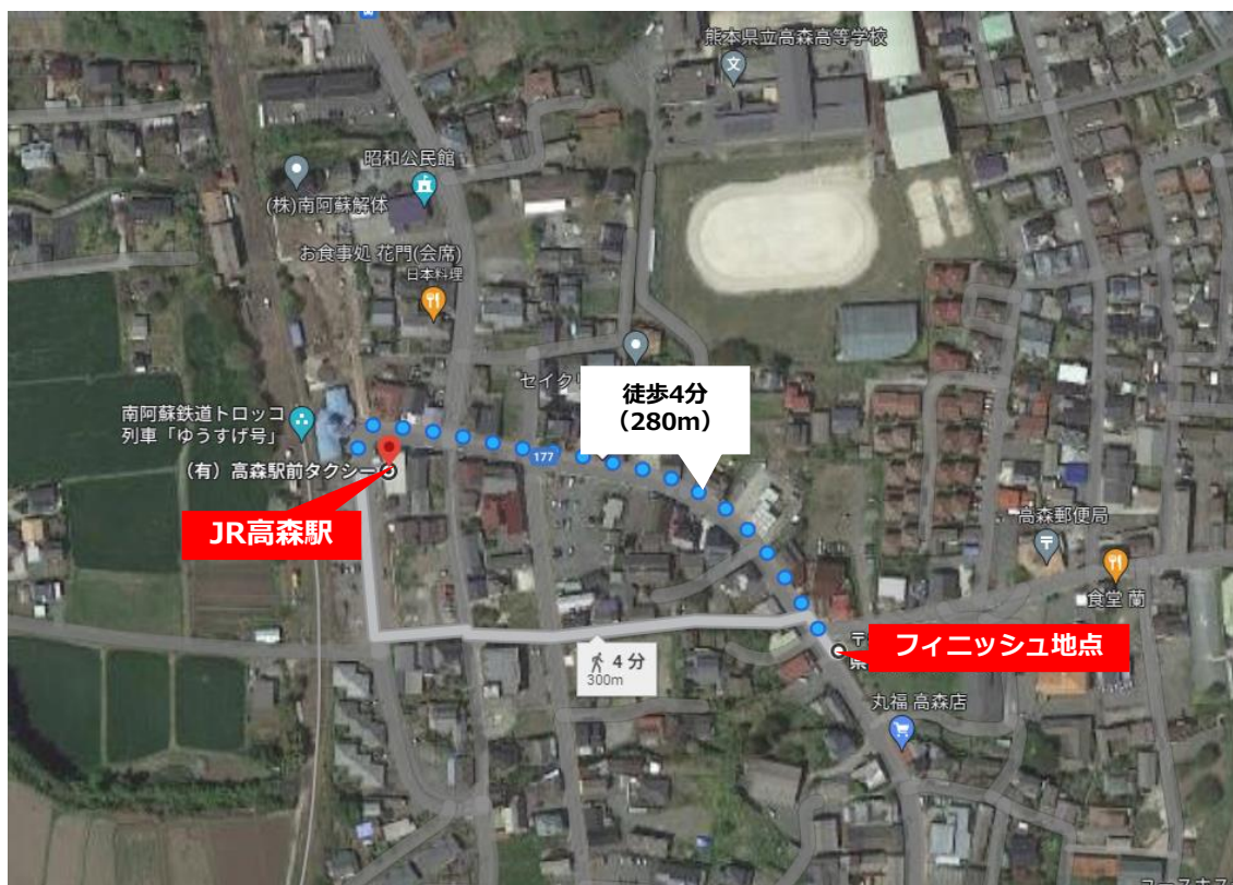
【フィニッシュ地点～高森駅 (280m徒歩4分)】