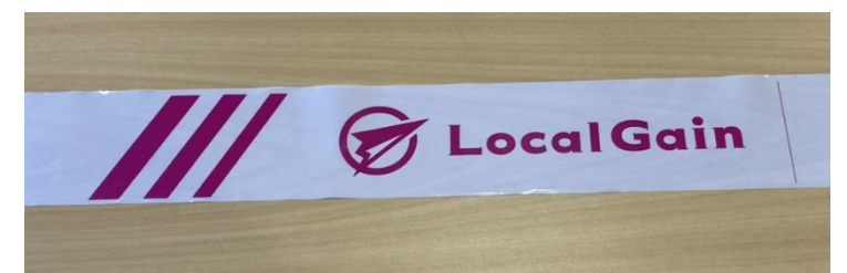
コーステープ実物写真