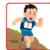
ウェアの胸部/腹部 取り付ける