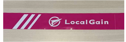
コーステープ実物写真