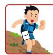
パンツに取り付ける