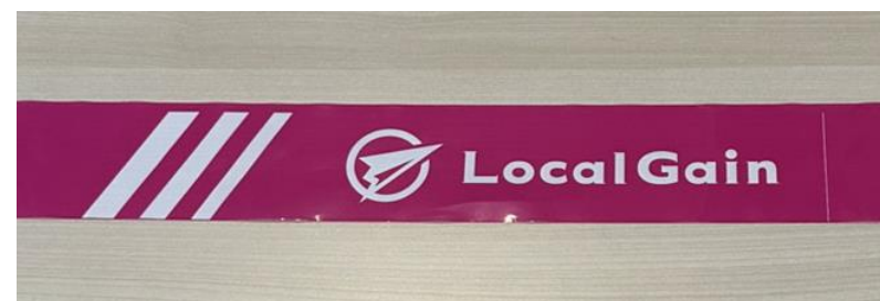
コーステープ実物写真