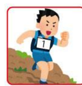
ウェアの胸部/腹部 取り付け