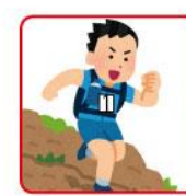
小さく折りたたむ