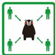
くっつかないモン #KeepDistance

自分が感染してなくても、もしかしたら、感染させるかも知れないとの意識を常に持ち、出来る限りの対策をよろしく願います。