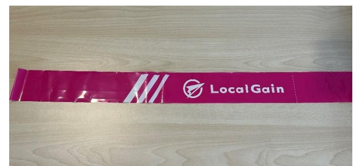
コーステープ実物写真