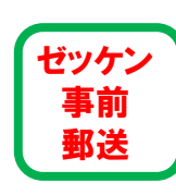
ゼッケン 事前 郵送