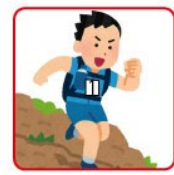
小さく折りたたむ