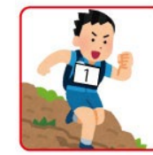
ウェアの胸部/腹部 取り付け