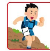
パンツに取り付ける