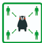
くっつかないモン #KeepDistance

また引き続きコロナ対策として、2週間の健康観察やマスクの着用、ソーシャルディスタンスの維持などへのご協力を重ねてお願いいたします。