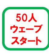
50人 ウェーブ スタート