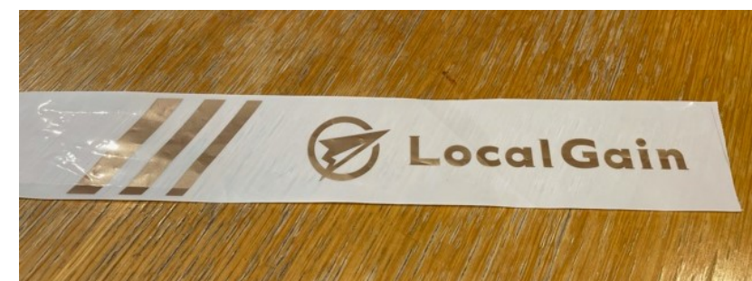
コーステープ実物写真