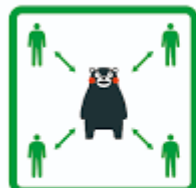
くっつかないモン #KeepDistance