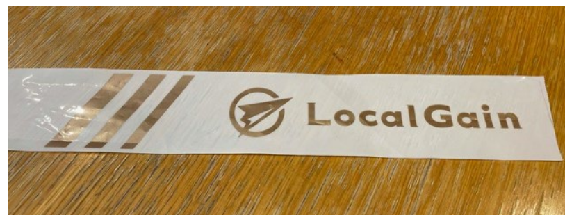
コーステープ実物写真