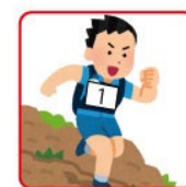
ウェアの胸部 / 腹部 取り付け