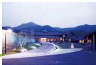
ゆのまえ温泉 湯楽里