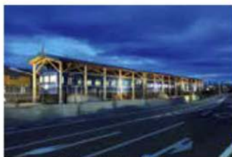
ブルートレインたらぎ